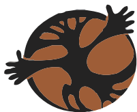
Kletterwald Dresdner Heide